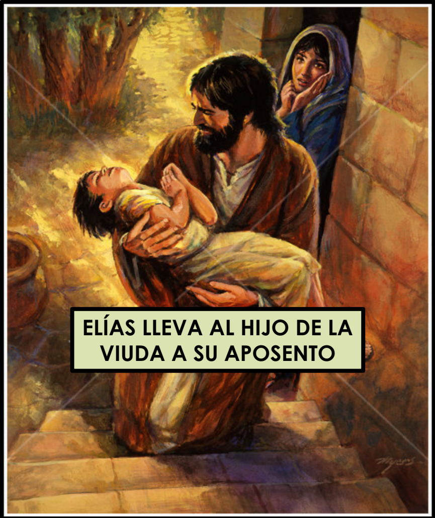
ELÍAS LLEVA AL HIJO DE LA VIUDA A SU APOSENTO

17 Después de estas cosas aconteció que cayó enfermo el hijo del ama de la casa; y la enfermedad fue tan grave que no quedó en él aliento . 18 Y ella dijo a Elías: ¿Qué tengo yo contigo, varón de Dios? ¿Has venido a mí para traer a memoria mis iniquidades, y para hacer morir a mi hijo? 19 Él le dijo: Dame acá tu hijo. Entonces él lo tomó de su regazo, y lo llevó al aposento donde él estaba, y lo puso sobre su cama.